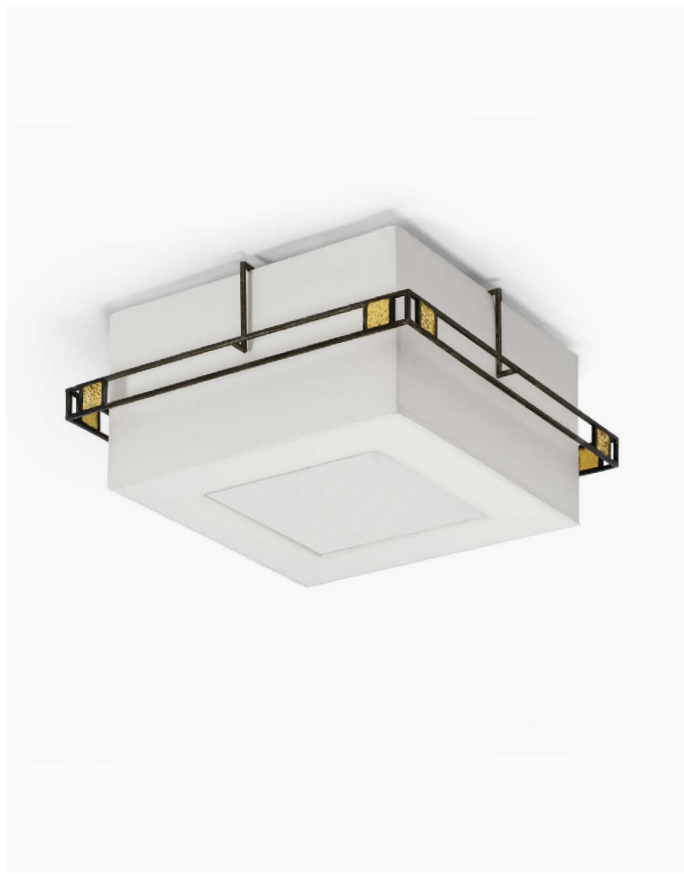
PLAFONNIER (13631) L 30 cm x P 30 cm x H 20 cm – 5 kg Feuille de laiton et patine