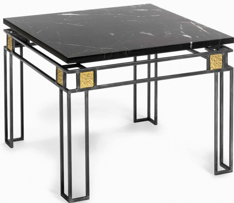
TABLE BASSE (13629) L 60 cm x P 60 cm x H 45 cm – 20 kg Feuille de laiton et patine