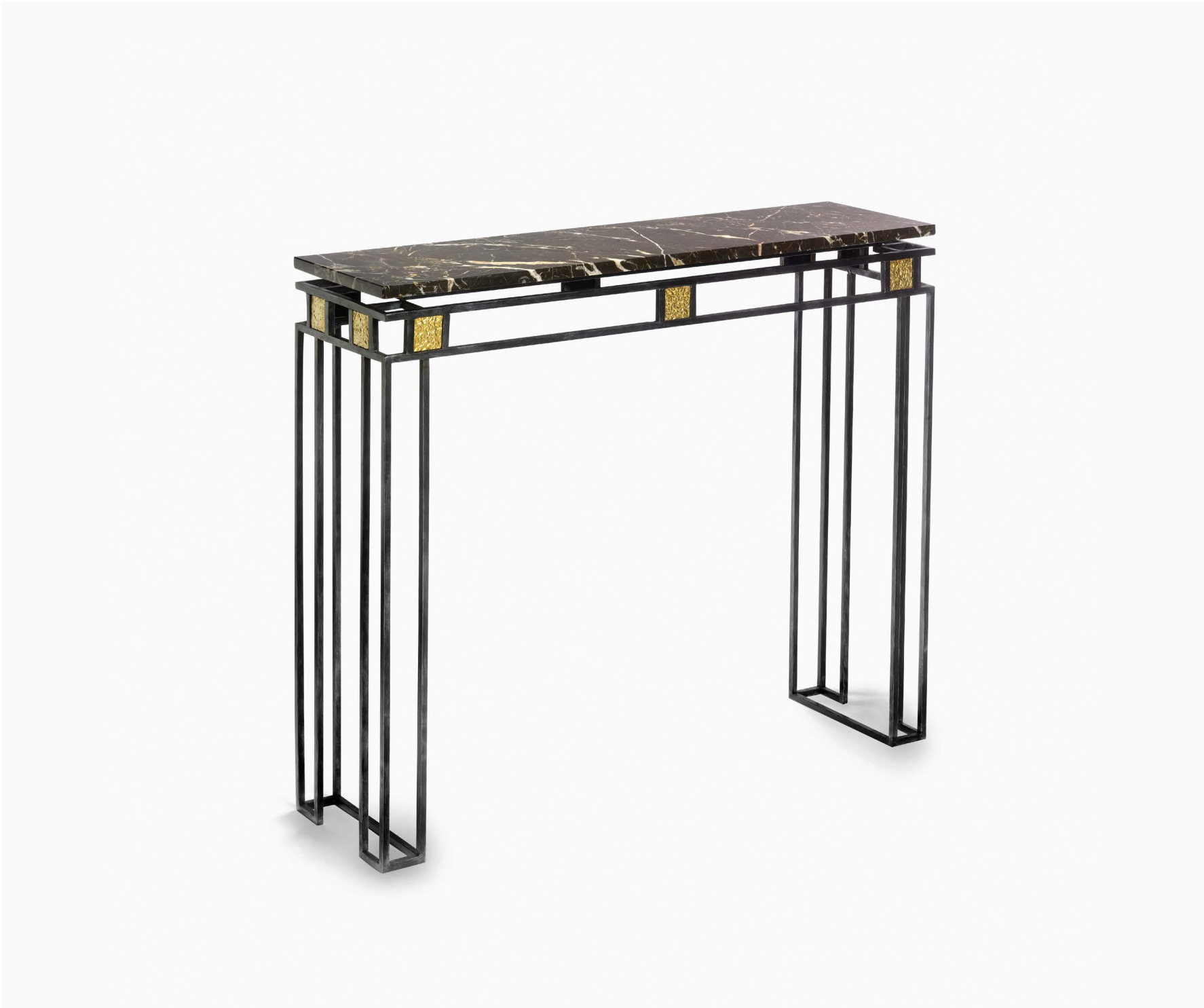
CONSOLE (13630) L 110 cm x P 30 cm x H 88 cm – 38 kg Feuille de laiton et patine