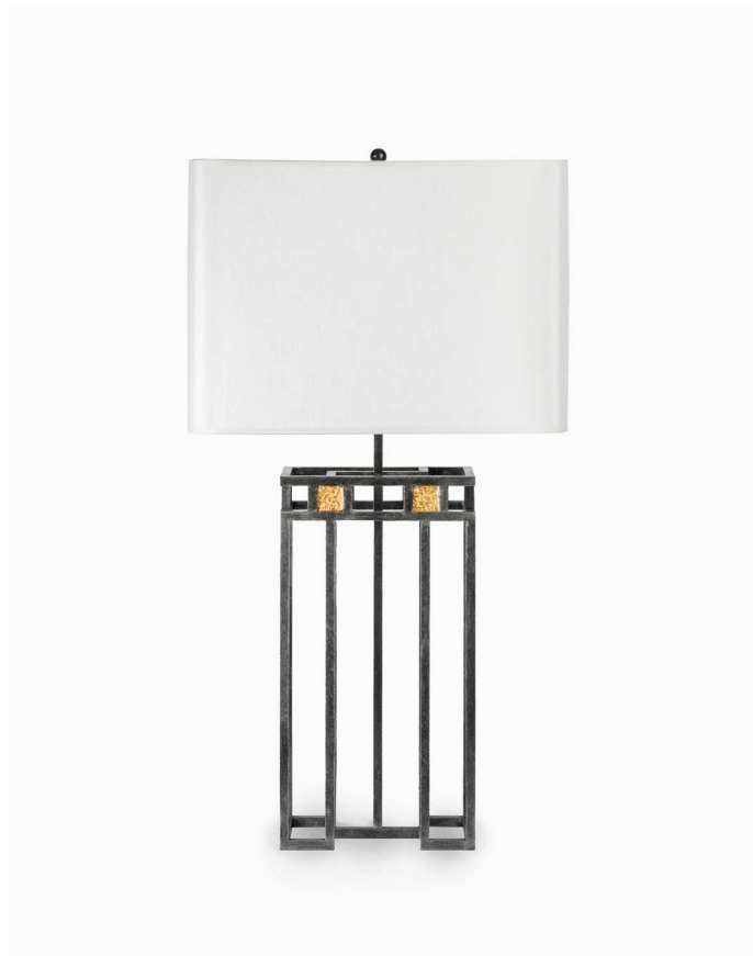
LAMPE (13861) L 37 cm x P 27 cm x H 73 cm – 5,5 kg Feuille de laiton et patine