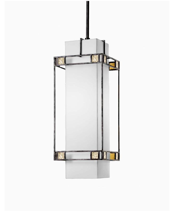
SUSPENSION (13636) L 110 cm x P 30 cm x H 70 cm – 15 kg Feuille de laiton et patine